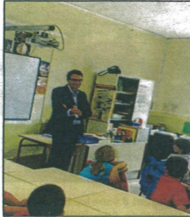
Questions-réponses avec les élèves.